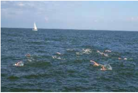
eerst de zwemmers