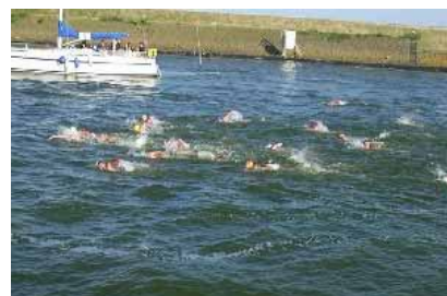
Start bij Stavoren