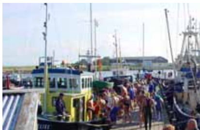
Zwemmers op de Elise

vraag "In welke richting moeten we zwemmen?"