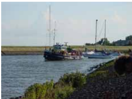
Zwemmers te water!

toch wel wat en de golven deinde behoorlijk. Om daar in te springen moet je toch wel moedig zijn zo 's morgens vroeg.